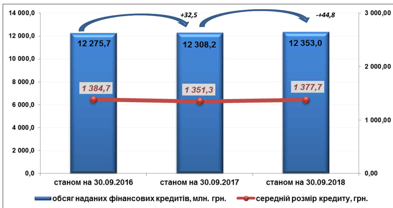
Рис. 2. Динаміка обсягів наданих фінансових кредитів та середнього розміру кредиту

Динаміку обсягів виданих кредитів та середнього розміру кредиту за 9 місяців 2016 – 9 місяців 2018 рр. зображено на рис. 2.